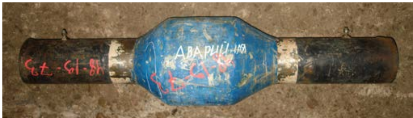
Фото 1. Общий вид вставки ЭВ, вышедшей из строя в процессе эксплуатации

На этой вставке при изгибе произошло разрушение внутреннего стеклопластикового вкладыша, что отчетливо видно на фото 2. Это явилось основной причиной потери герметичности всей уплотнительной системы данной конструкции электроизолирующей вставки, хотя была предусмотрена 3-уровневая