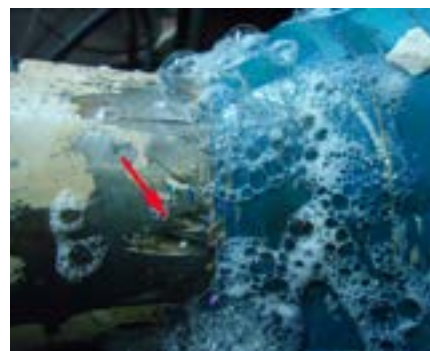
Фото 2. Разрушение внутреннего стеклопластикового вкладыша

стальные патрубки, соответствующие по наружному диаметру и толщине стенки защищаемому от коррозии трубопроводу. Различие состоит в том, как выполнены силовые элементы, выдерживающие большие осевые, радиальные и изгибающие нагрузки, а также в конструкции уплотнительных элементов, от которых зависит их эксплуатационная надежность. Основной недостаток конструкции вставок СИ, SHD и ИММ состо-